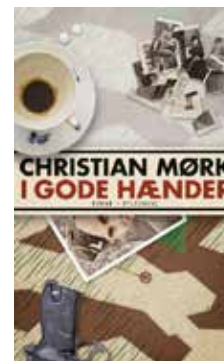
Christian Mørk I gode hænder Gyldendal, 219 sider, 249 kr.