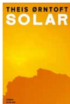
Theis Ørntoft Solar 300 sider, Gyldendal